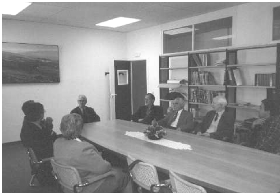
Junta actual del Patronato de la Fundación Proyecto Hombre Navarra