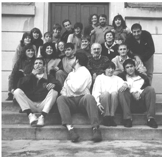
Trabajadores de los comienzos