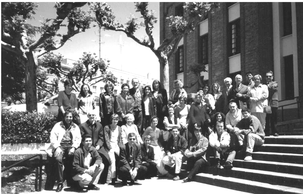
Trabajadores y Fundación actuales