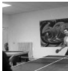
Actividades de Suspertu

* Para el cálculo de esta cifra se ha sumado el número de entrevistas familiares, las entrevistas de adolescentes, los encuentros familiares, las coordinaciones con otros profesionales, y el número de sesiones promedio de escuela de padres en el año, teniendo en cuenta 4,5 jornadas dedicadas a la atención directa).