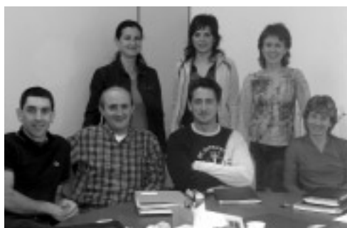
Equipo de Suspertu

Ante la cantidad de demandas de asesoramiento y formación recibidas, tanto la dirección de los programas, como la Fundación Proyecto Hombre de Navarra , optaron por relanzar la labor de un técnico en prevención. A partir de Abril de 2005 y hasta la fecha, continuamos con un gran número de demandas. Tenemos fechas programadas hasta final mayo de 2006.